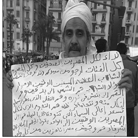
مواطن أمى يرفع مجلته الخاصة في التحرير