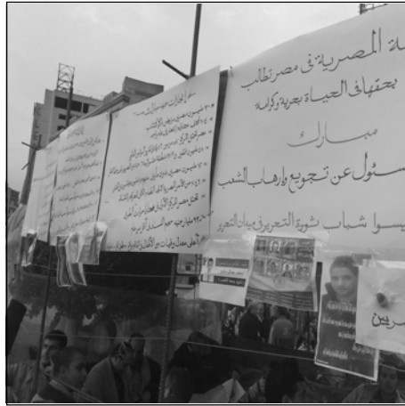
.. ومجلة حائط تتحدث عن سلبيات عهد مبارك